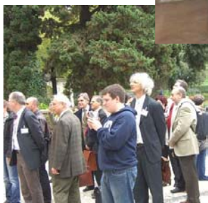
Convegnisti in visita a Villa d'Este