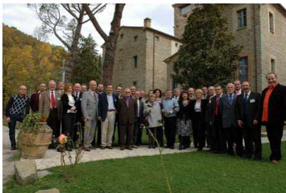
Classica foto di gruppo di tutti i rappresentanti regionali FENIARCO

popolare, realizzato in occasione della "Giornata di studi in onore del M° Domenico Cieri" saranno pubblicati nella collana didattica edita dalla FENIARCO.